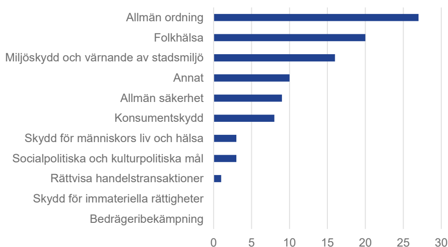
Figur 3. Anmälningar per skyddsintresse 2023

Normalt brukar majoriteten av anmälningarna avse regler på nationell central nivå, såsom lagar, och resterande anmälningar avser bestämmelser på lokal/regional nivå. I och med att Lettland 2023 anmälde hela 31 av 47 regleringar på lokal nivå blev just detta år förhållandet mellan den nationella centrala nivån och lokala regleringar någorlunda jämn totalt sett. De flesta av anmälningarna från EU-länderna gällde krav tillämpliga på alla typer av tjänsteutövning, det vill säga både gränsöverskridande tjänster och krav som ställs på permanent etablerade tjänsteutövare.