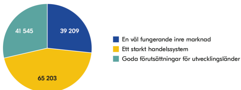
Figur 2. Kostnader per verksamhetsområde 2024

Förvaltningsanslaget uppgick till 105,1 miljoner kronor 2024 och vi hade ett ingående anslagssparande på 2,9 miljoner kronor och en indragning på 60 tusen kronor samtidigt som utgifterna på anslaget uppgick till 107,5 miljoner kronor, inklusive transfereringar. Utfallet innebär ett utgående anslagssparande på 433 tusen kronor.