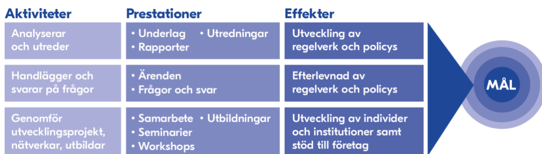
Figur 1. Verksamhetslogik

För att mäta effekterna av hur regelverk och policys utvecklas utvärderar vi rapporter och analyser som vi publicerat under året. Detta gör vi genom att följa upp hur de sprids och hur innehållet används vidare av andra aktörer som exempelvis EU-kommissionen och världshandelsorganisationen (WTO). I utvärderingen tittar vi även på hur väl hållbarhetsdimensionerna har integrerats och hur innehåll och slutsatser kopplar till målen i Agenda 2030.